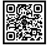
뉴아티 글쓰기 북클럽

뉴아티 글쓰기 북클럽 & 뉴북스 작가 브랜딩 스터디 키워드 : #나다움 #아웃풋 #퍼스널브랜딩 #글쓰기모임