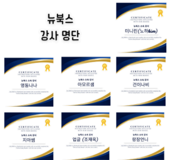
큐리어스 어울림, 라이브클래스, 굿픽칼리지