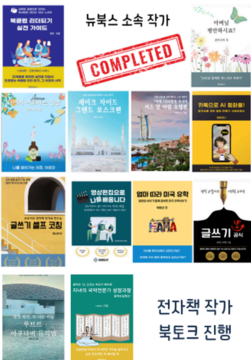
전자책 작가 북토크 진행

뉴북스는 자신만의 콘텐츠로 전자책을 쓰고, 강의나 모임을 통해서 퍼스널 브랜딩을 함께 해나가고 있는 스터디 모임으로 시작했습니다. 23년 한 해 동안 뉴북스 팀원들은 함께 전자책을 쓰고, 강의를 준비하고 기획하고 강사가 되는 아웃풋을 실천했습니다. (본문)